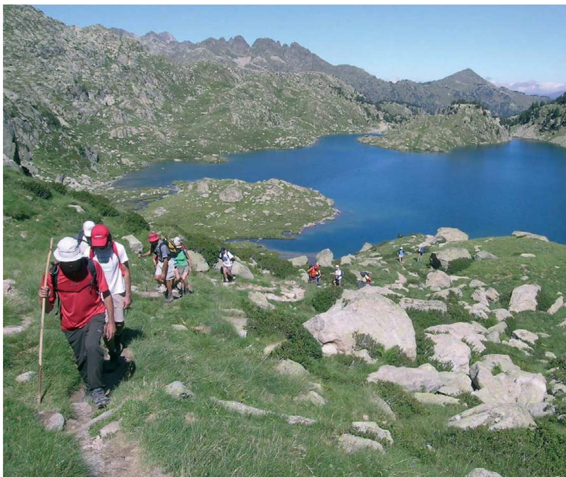
Lacs de Colomers